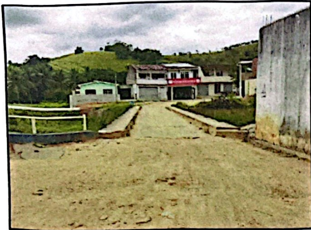
Ponte do Rosário