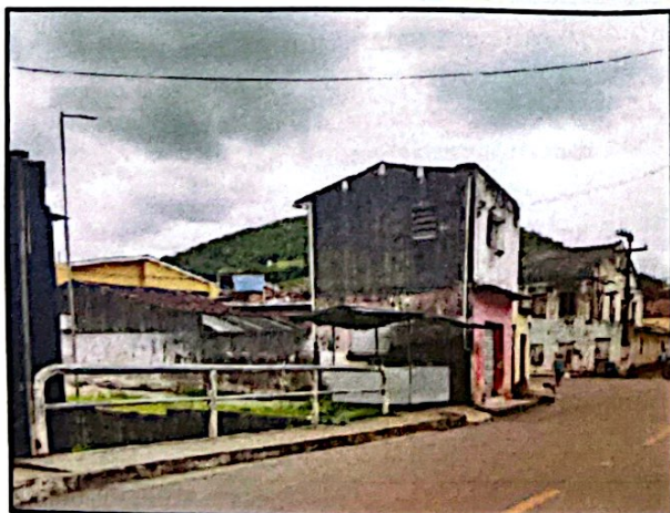
Ponte do Rio Sueira