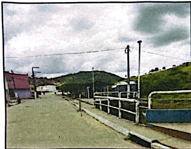
Ponte próxima aos Correios