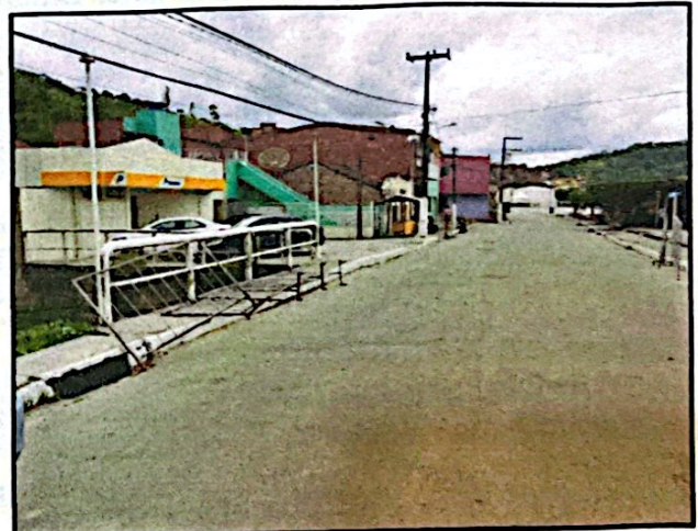
Ponte próxima aos Correios