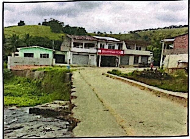
Ponte do Rosário